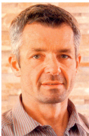
Autor: Božidar Bajsič, direktor prodaje, Panteon Group®